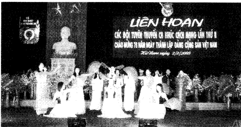
A performance at 2 nd Festival of Revolutionary Songs Propagandising Groups, and 75 th Anniversary of Vietnam Communist Party

and voluntary to make homeland beautiful and powerful for happiness and bright future of the youth" has helped gather strengths and action orientations, lightening Ha Nam young people's road to future.