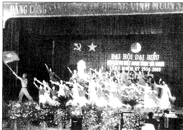
Đại hội đại biểu Hội liên hiệp thanh niên Việt Nam tỉnh Hà Nam lần thứ II, nhiệm kỳ 2004 - 2009

Năng nổ tham gia các hoạt động: từ giữ gìn trật tự an toàn giao thông, hiến máu nhân đạo, tuyên truyền các ca khúc cách mạng, đến việc tham gia xây dựng giao thông nông thôn, nạo vét thủy lợi nội đồng, tham gia phát triển kinh tế,... những thanh niên tình nguyện với màu áo xanh bình dị đã trở nên gần gũi, thân thương với mỗi người dân Hà Nam. Hưởng ứng các phong trào hành động do Tỉnh đoàn phát động, lớp lớp đoàn viên, thanh niên Hà Nam đã và đang phát huy xứng đáng truyền thống cách mạng của quê hương, đảm nhiệm vai trò xung kích, đi đầu trong sự nghiệp phát triển kinh tế - xã hội.