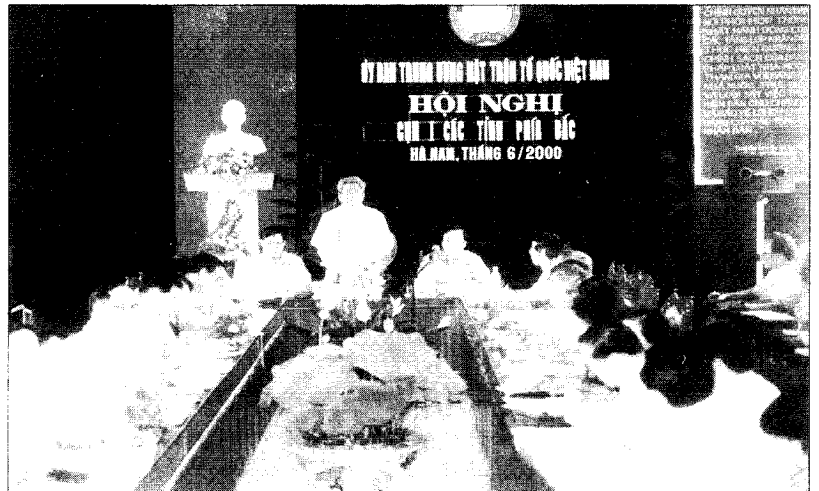
Ông Phạm Thế Duyệt - Chủ tịch Đoàn Chủ tịch Ủy ban Trung ương Mặt trận Tổ quốc Việt Nam chủ trì Hội nghị cụm 1 mặt trận tổ quốc các tỉnh phía Bắc tổ chức tại Hà Nam (tháng 6-2000)

nguyện vọng của mọi tầng lớp nhân dân. Thẩm nhuần định hướng ấy, Ủy ban Mặt trận Tổ quốc và nhân dân Hà Nam đã quyết tâm "chung sức, đồng lòng", góp phần tạo dựng diện mạo đời sống kinh tế - xã hội đầy khởi sắc.