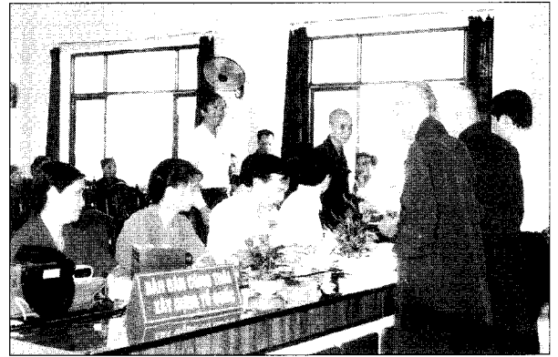
Ủy ban Mặt trận Tổ quốc Hà Nam phát động các chức sắc tôn giáo trong tỉnh mua công trái xây dựng Tổ quốc

Hướng tới xây dựng quê hương ngày càng giàu đẹp, dưới sự chỉ đạo của Ủy ban Mặt trận Tổ quốc Việt Nam, mặt trận đã đoàn kết công giáo và Ban Trị sự Hội Phật giáo tổ chức thành công cuộc vận động các chức sắc tôn giáo và đồng bào thực hiện nếp sống "tốt đời đẹp đạo", vận động những người con Hà Nam xa xứ góp sức xây dựng quê hương.